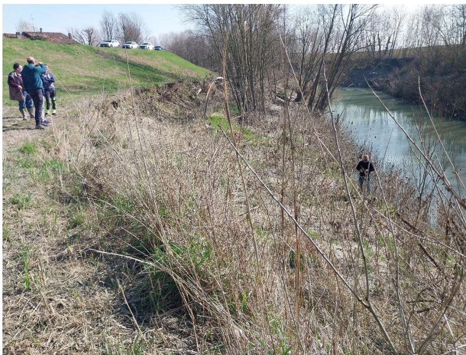
Figura 2 - Erosione in sponda sinistra stante 30 a valle della difesa esistente