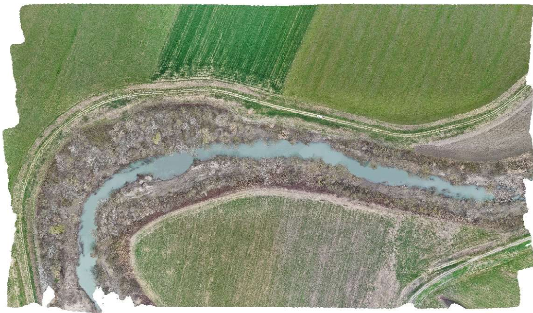
Figura 3 - Erosione in sponda sinistra stante 24