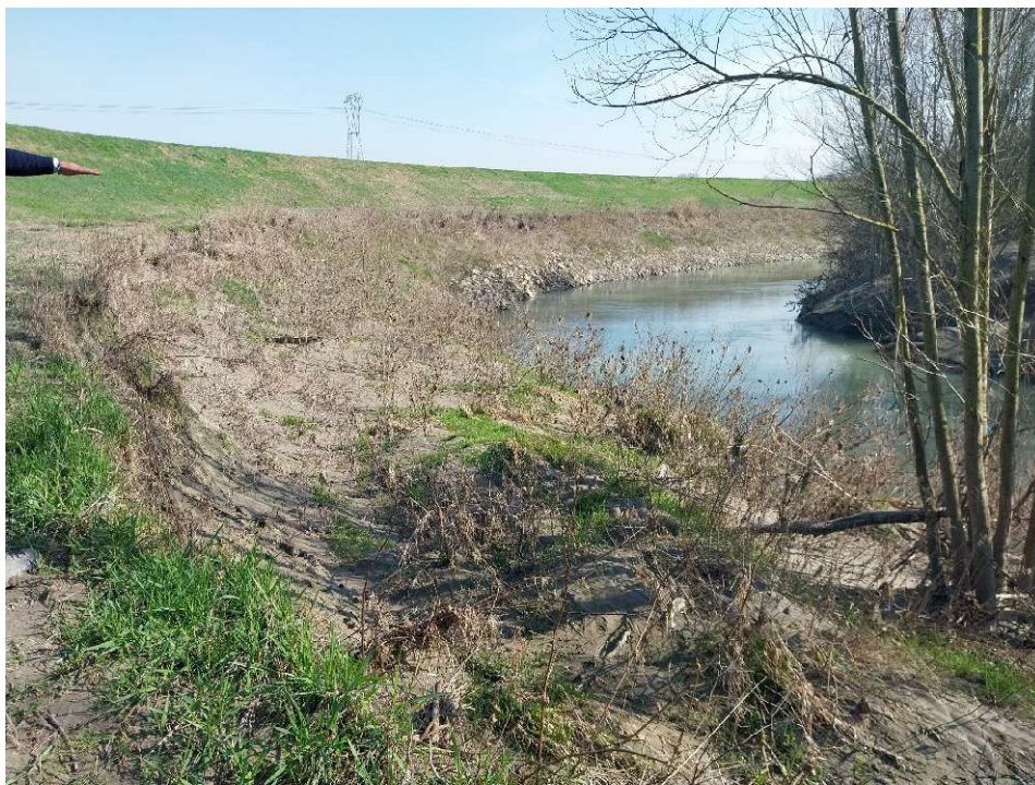
Figura 1 - Erosione in sponda sinistra stanti 30 a monte difesa esistente